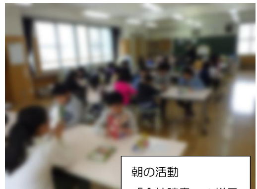
朝の活動 「全校読書」の様子

明日から大型連休です。どんなふうに過ごしますか。ご家族で旅行に行ったり、遊園地で楽しんだり、家でのんびりする人、それぞれかと思えます。休みが続くと、生活が不規則になりがちです。集中して勉強するためにも、運動が上手にできるようになるためにも、そして病気やけがの予防にも、“早寝・早起き・朝ごはん”がしっかりでき、生活リズムが整っていることがとても大切です。ご家庭でも、規則正しい生活を保ち、毎日の朝ご飯をしっかりと食べさせる習慣のもと、子どもたちの健やかな成長と逞しい体づくりのため、お力添えをよろしくお願いいたします。