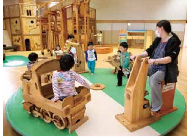
木製遊具で木に親しむ〈木夢〉

安心して、働きながら子育てができる「安心な村」づくりを継続します。住み慣れた村で、健康で暮らせる「元気な村」づくりを継続します。誰もが安心して生活できるノーマライゼーションの社会(地域)安心な村を継続します。