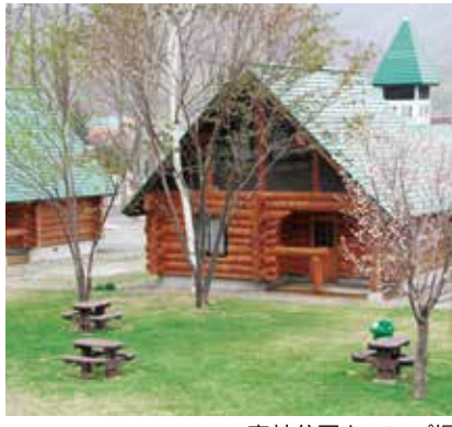
森林公園キャンプ場