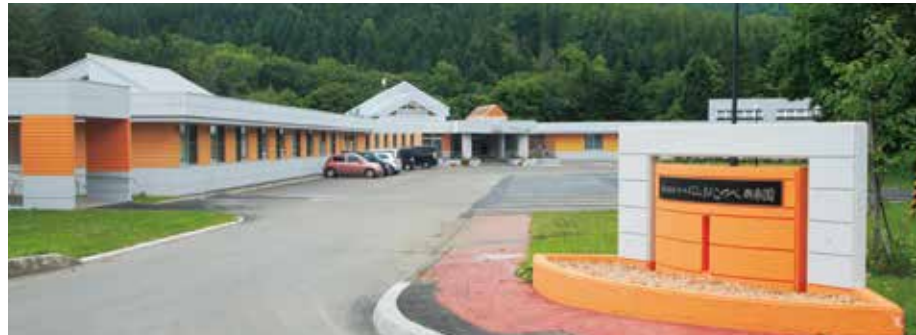
特別養護老人ホーム「興楽園」