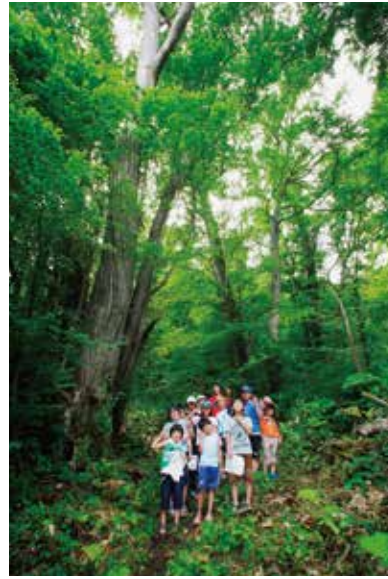
木育の里山「宮の森」