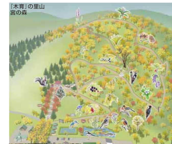
「木育」の里山 宮の森