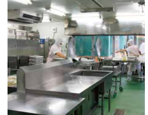
学校給食センター