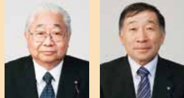
教育長 鎌谷 俊夫