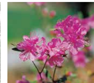
●村の花/エゾムラサキツツジ