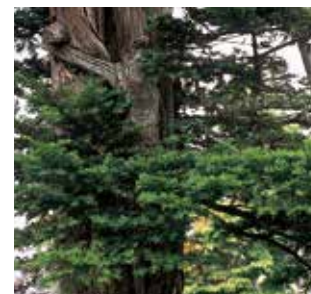
●村の木/イチイ(オウコ)