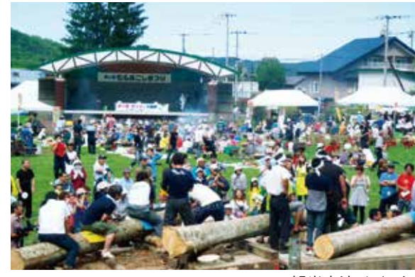
観光交流イベント