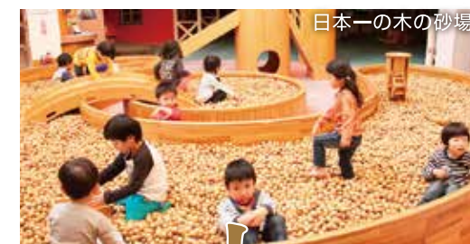
日本一の木の砂場